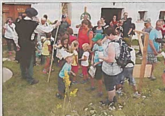
Die Geister- und Sagenwanderung – heuer am 16. Juli – ist ein wahrer Publikumsmagnet geworden.

Bühne geht. Am Samstag, dem 16. Juli, werden erneut Geister und Mythen „ausgepackt“. Die Wanderung kann zwischen 16 und 18 Uhr begonnen werden. Das Team der öffentlichen Bücherei Wullersdorf und des Dorferneuerungsvereins Hart-Aschendorf hat sich für seine Besucher allerhand Abenteuer überlegt. Mehr Infos online: www.geister-und-sagenwanderung.at