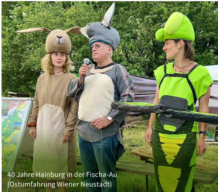
40 Jahre Hainburg in der Fischa-Au (Ostumfahrung Wiener Neustadt)