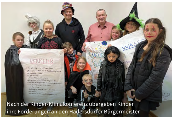
Nach der Kinder-Klimakonferenz übergeben Kinder ihre Forderungen an den Hadersdorfer Bürgermeister