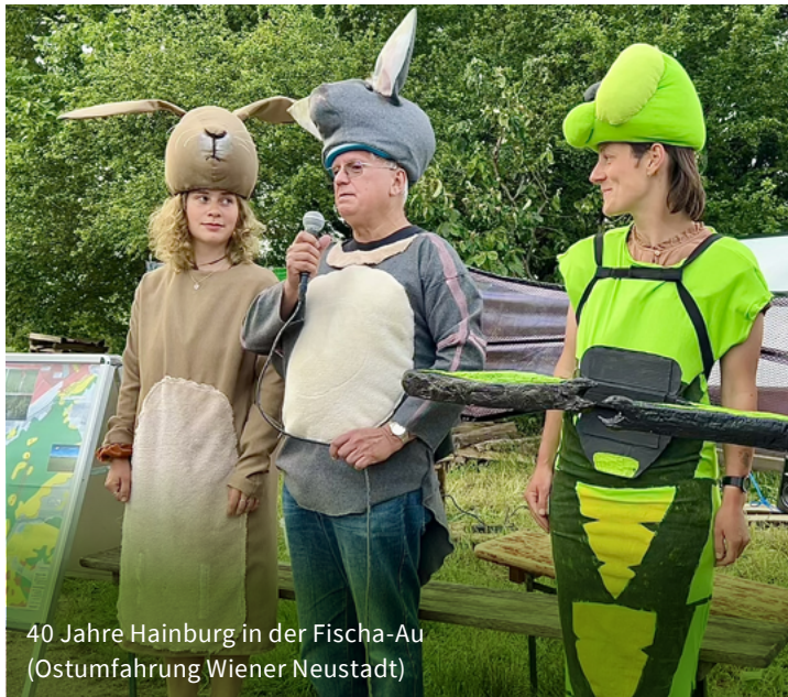
40 Jahre Hainburg in der Fischa-Au (Ostumfahrung Wiener Neustadt)