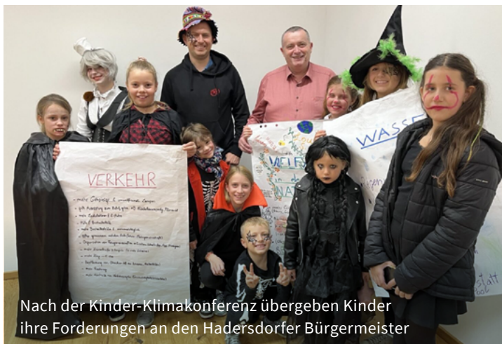
Nach der Kinder-Klimakonferenz übergeben Kinder ihre Forderungen an den Hadersdorfer Bürgermeister