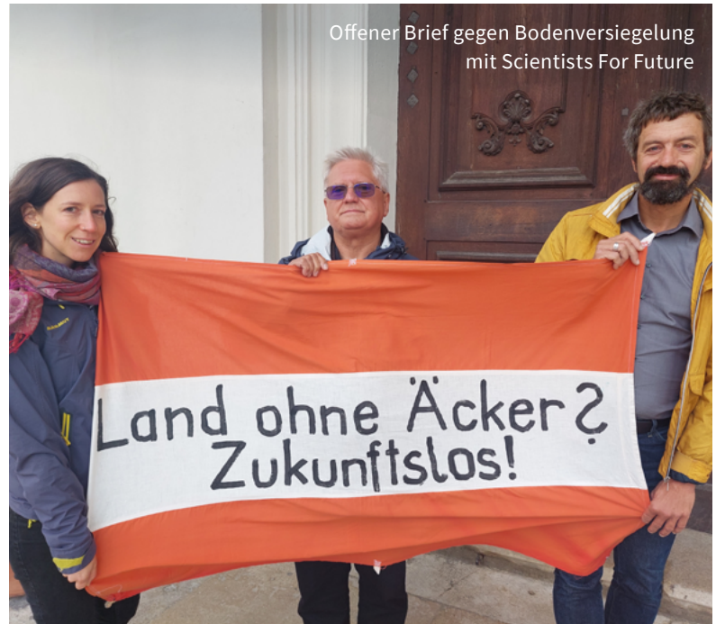
Offener Brief gegen Bodenversiegelung mit Scientists For Future