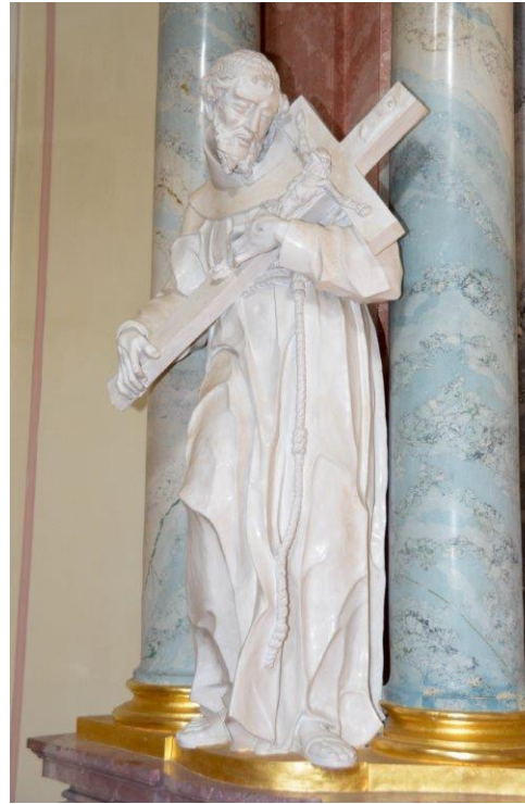
Franziskus-Statue am Johannes-Nepomuk-Altar Pfarrkirche Göllersdorf