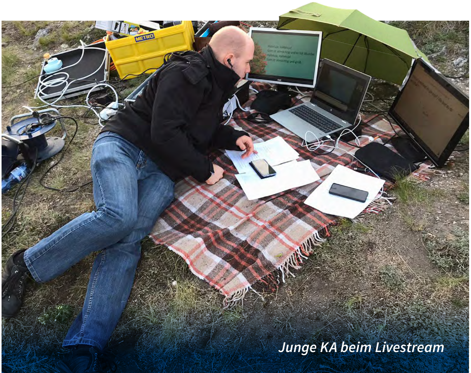
Junge KA beim Livestream