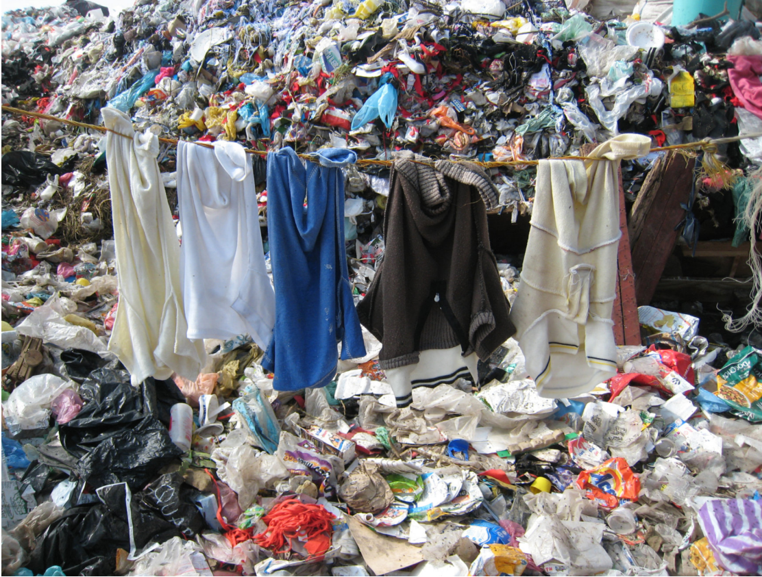
Das Bild zeigt eine Mülldeponie in Mexiko.